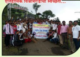
ऐतिहासिक विश्रामगडाची स्वच्छता...

राष्ट्रीय सेवा योजनेच्या वतीने आयोजित रक्तदान शिबीरात सहभागी विद्यार्थी.