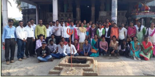
→ भूगोल विभाग शैक्षणिक सहल श्रीजगदंबा माता मंदिर, टाहाकारी.