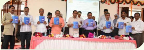
स्मरणिकेचे प्रकाशन करताना चर्चासत्रास उपस्थित मान्यवर.