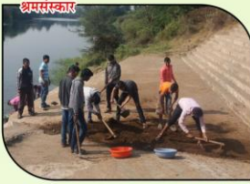
राष्ट्रीय सेवा योजनेच्या म्हाळादेवी येथील हिवाळी शिबीरात श्रमदान करताना विद्यार्थी.