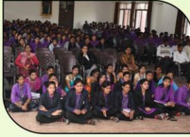
चर्चासत्रास उपस्थित विद्यार्थी.