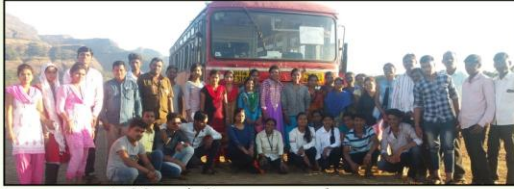
→ इंग्रजी विभाग शैक्षणिक सहल रतनगड, कोकडकडा, साप्रद.