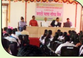
मराठी भाषा गौरव दिन प्रसंगी उपस्थित मान्यवर.