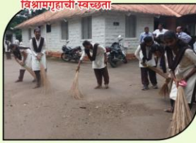
स्वच्छता पंधरवाड्यानिमित्त अकोले येथील विश्रामगृहाची स्वच्छता करताना विद्यार्थिनी.