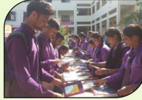
वाचन प्रेरणा दिनानिमित्त ग्रंथ संपदेची माहिती घेताना विद्यार्थी.