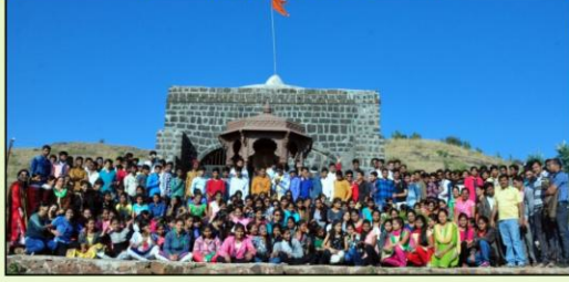
→ संगणक विभाग शैक्षणिक सहल विश्रामगड (पट्टाकिल्ला), ता. अकोले.