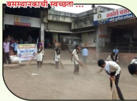
स्वच्छता पंधरवाड्यानिमित्त अकोले येथील बसस्थानकाची स्वच्छता करताना स्वयंसेवक.