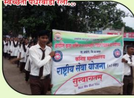
स्वच्छता पंधरवाड्यानिमित्त स्वच्छता रंलीत सहभागी राष्ट्रीय सेवा योजनेचे स्वयंसेवक.